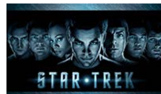
Fig. 8: Abrams' nye Star Trek line-up anno 2009, tilsat den cool opdaterede typografi - og fiars naturligvis.