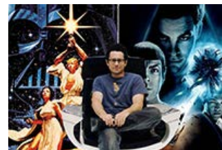
Fig. 13: May the force be with you, J.- J.- Abrams.