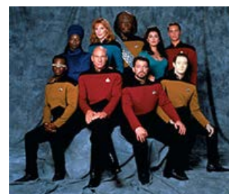
Fig. 5: Patrick Stewart i front som kaptajn Jean-Luc Picard med the next generation.