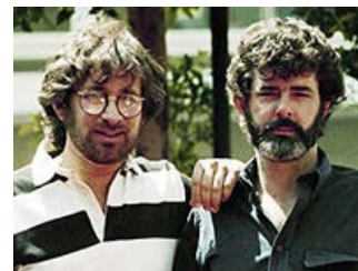
Fig. 11: Spielberg og Lucas i deres knivskarpe storhedstid. Laugh it up fuzzleball.