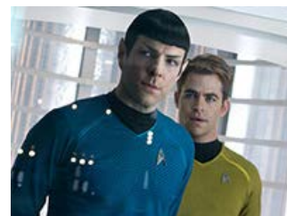
Fig. 10: Kirk og Spock bromance.

Kunne James Kirk være min nye Han Solo? Måske. Engang. Han har i hvert fald potentiale.