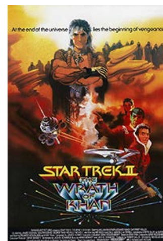
Fig. 4: Original plakat til Wrath of Khan med Ricardo Montalban i rollen som den modificerede superskurk Khan.

Endelig savner jeg plads i fortællingen til, at karakterernes indbyrdes forhold virkelig kan mærkes. Venskabet mellem Kirk og Spock og deres respektive personlige udvikling er naturligt et vigtigt element i filmens drivkraft. Den rebelske, følelsesstyrede Kirk er ved at lære at blive en autoritet med kontrol over sine impulser, hvorimod den umiddelbart følelesløse halvt vulcan, halvt menneske, Spock, er ved at lære at slippe kontrollen og være ven og kæreste. Det virker til dels. Men der mangler noget. Der mangler plads i fortællingen til, at karakterernes samspil virkelig kan mærkes. De fungerer godt hver for sig, men jeg mangler at føle rigtigt med dem. Hvilket også gør, at da filmen når sit dramatiske højdepunkt med et tragisk udfald, kan jeg heller ikke rigtigt mærke det. Tværtimod er det lige før, at den forcede alvor bliver lidt