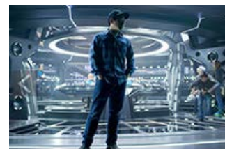
Fig. 7: Kaptajn J. J. Abrams på broen.