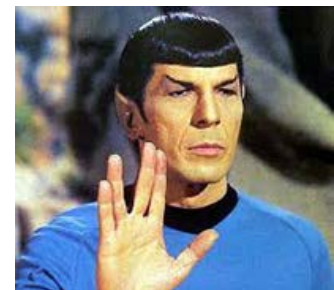
Fig. 3: V for Vulcan. Leonard Nimoy som den oprindelige Spock, der også spiller en mindre rolle i det nye Star Trek univers.