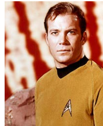
Fig. 2: William Shatner som den oprindelige kaptajn James Kirk.