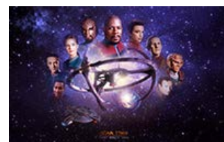
Fig. 6: 3 forskellige Star Trek spin-off serier blev lanceret efter succesen med The Next Generation: Deep Space Nine (1993-1999), Voyager (1995-2001) og Enterprise (2001-2005).