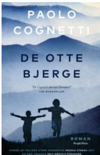
(/boeger/de-otte-bjerge) DE OTTE BJERGE (/BOEGER/DE-OTTE-BJERGE) Af Paolo Cognetti (f. 1978)