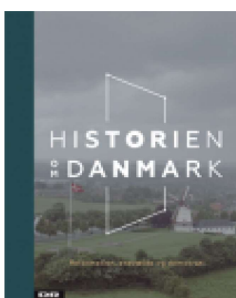
HISTORIEN OM DANMARK 2

( http://www.historie-online.dk/boger/anmeldelser-5-5/historie-og-topografi-11-11-11/historien-om-danmark-2 )