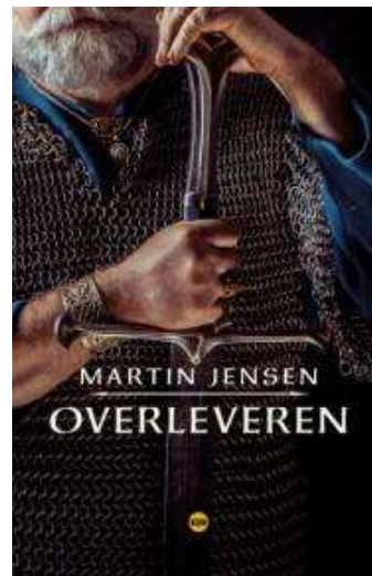
(/boeger/overleveren) OVERLEVEREN (/BOEGER/OVERLEVEREN) Af Martin Jensen