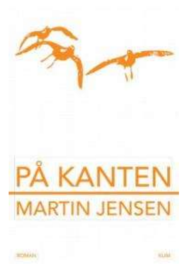
(/boeger/pa-kanten) PÅ KANTEN (/BOEGER/PA-KANTEN) Af Martin Jensen