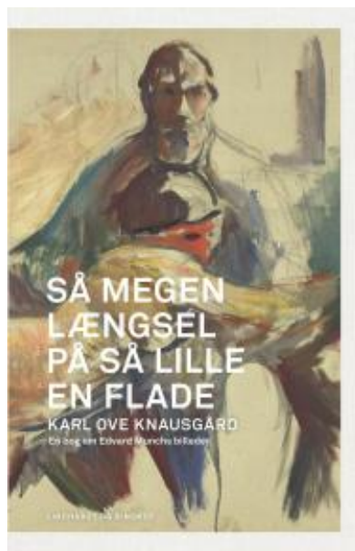
(/boeger/sa-megen-laengsel-pa-sa-lille-en-flade) SÅ MEGEN LÆNGSEL PÅ SÅ LILLE EN FLADE (/BOEGER/SA-MEGEN-LAENGSEL-PA-SA-LILLE-EN-FLADE) Af Karl Ove Knausgård