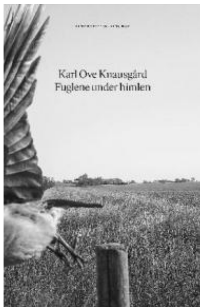
(/boeger/fuglene-under-himlen) FUGLENE UNDER HIMLEN (/BOEGER/FUGLENE-UNDER-HIMLEN) Af Karl Ove Knausgård