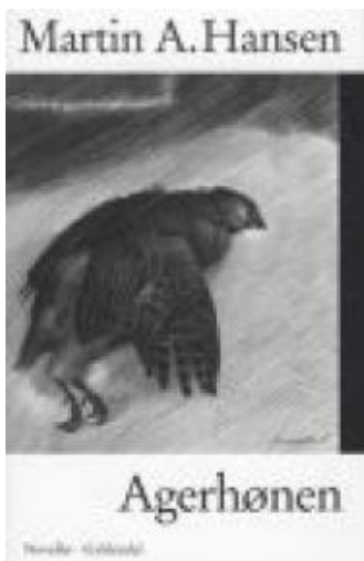
(/boeger/agerhonen-0) AGERHØNEN (/BOEGER/AGERHONEN-0) Af Martin A. Hansen