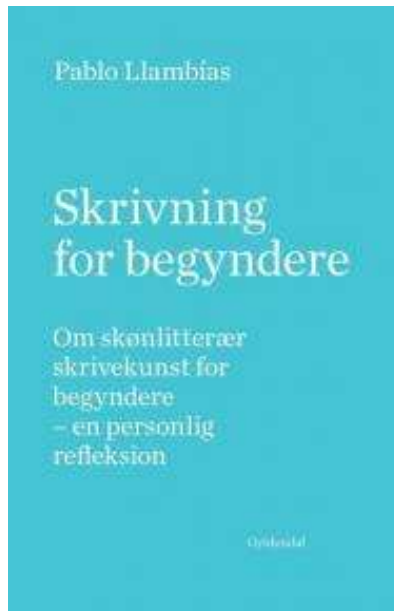
(/boeger/skrivning-begyndere) SKRIVNING FOR BEGYNDERE (/BOEGER/SKRIVNING-BEGYNDERE) Af Pablo Llambías