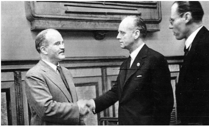
Molotov og Ribbentrop i 1939.