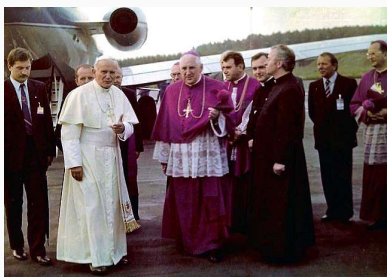
Pavebesøg i Polen, 1987.

Det var første gang, polsk tv transmitterede en gudstjeneste. Det er også en fin iagttagelse, at Tjekkoslaviets forsøg på at indføre ”socialisme med et menneskeligt ansigt” i 1968 hurtigt fik komparative problemer. Hvis det kun var i Tjekkoslaviet, socialismen havde et menneskeligt ansigt, hvilket ansigt havde socialismen så i for eksempel Sovjetunionen?