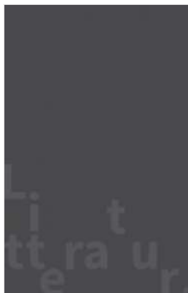
(/boeger/det-fremmede-barn) DET FREMMEDE BARN (/BOEGER/DET-FREMMEDE-BARN) Af E. T. A. Hoffmann