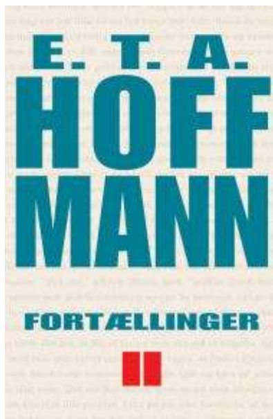
(/boeger/fortaellinger-ii) FORTÆLLINGER II (/BOEGER/FORTAELLINGER-II) Af E. T. A. Hoffmann