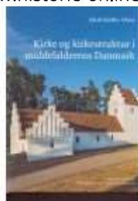
KIRKE OG KIRKESTRUKTUR I MIDDELALDERENS DANMARK

( http://www.historie-online.dk/boger/nfs-grundtvig )