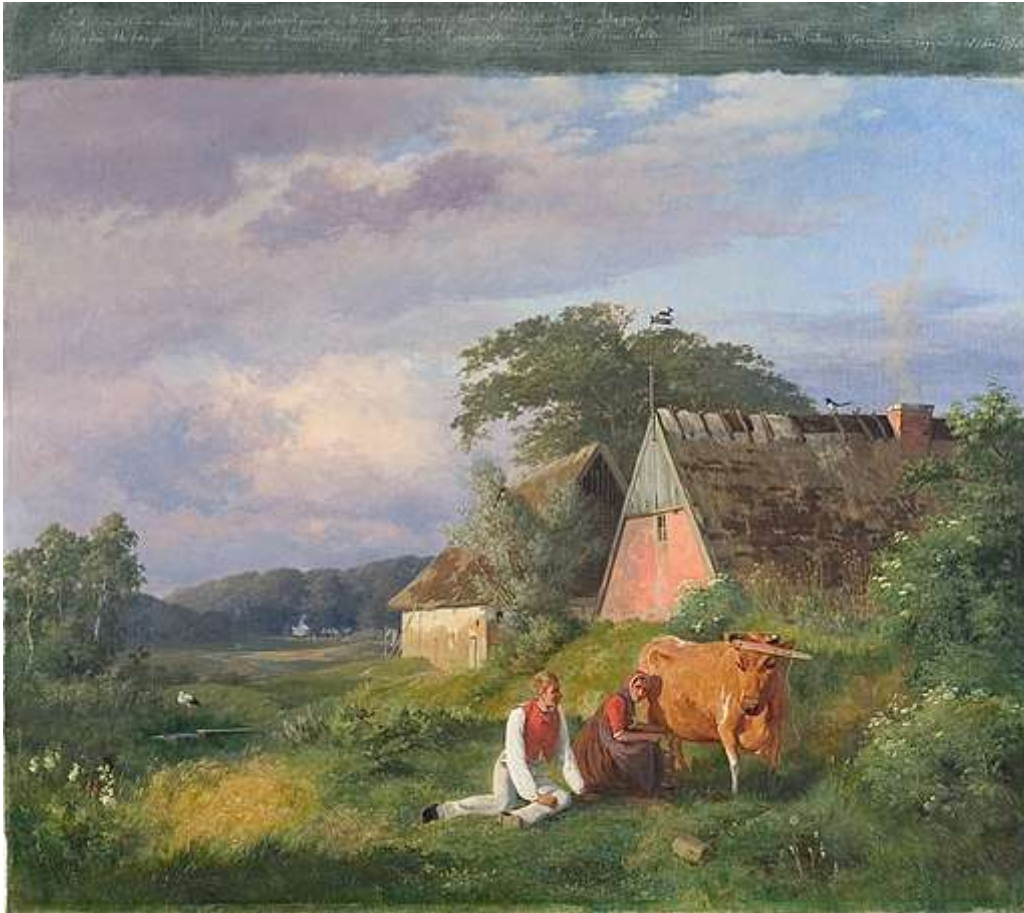
Idyllisk malkescene i Johan Thomas Lundbyes maleri fra 1841.

Bogen er en blanding af personlige erindringer, teoretiske overvejelser, mentalitetshistorie og aktuelle kommentarer. Den består for en stor del af analyser af litteratur, billedkunst og folkelig underholdning. Dertil kommer historiske redegørelser om forholdet mellem borgerskab og bønder. Vi får at vide, at ”provinsen blev skumfødte i guldalderen af en rig og magtfuld overklasse i København som forestillinger om det gode liv i Guds natur.”