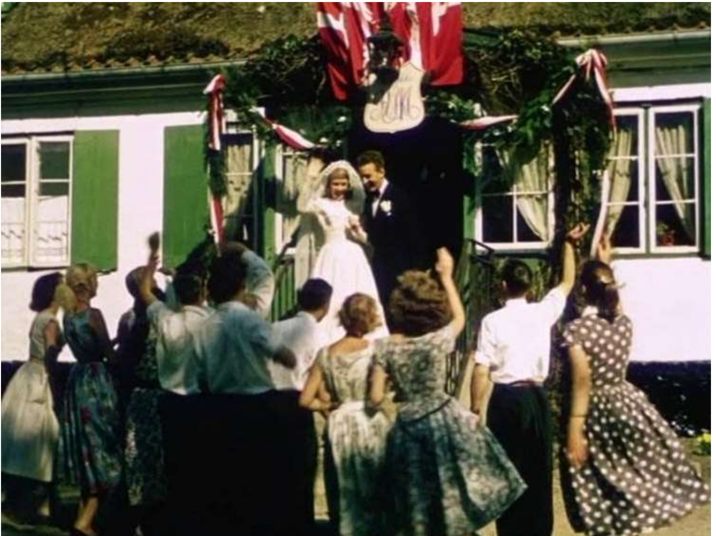
Bryllup på Bakkegaarden.

er blevet væk, men heldigvis findes den. Satan jages på porten, og alt ender i salig fryd. Det var en fortælling, som folk på landet havde lært i skole og kirke.