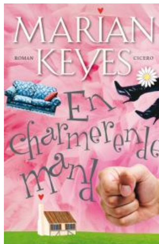
(/boeger/en-charmerende-mand) EN CHARMERENDE MAND (/BOEGER/EN- CHARMERENDE-MAND) Af Marian Keyes