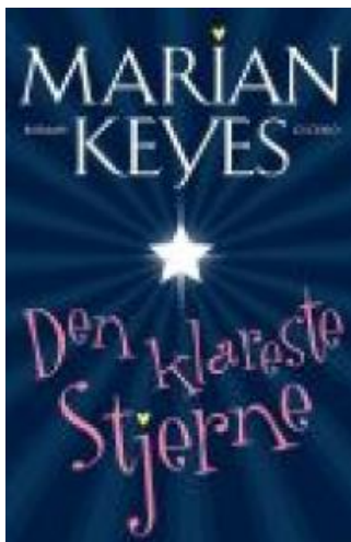
(/boeger/den-klareste-stjerne) DEN KLARESTE STJERNE (/BOEGER/DEN- KLARESTE-STJERNE) Af Marian Keyes