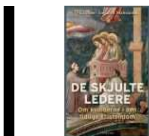
DE SKJULTE LEDERE