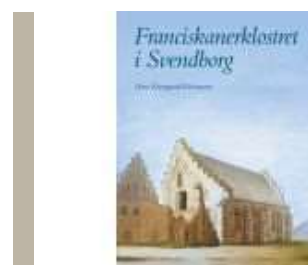
FRANCISKANERKLOSTRET I SVENDBORG