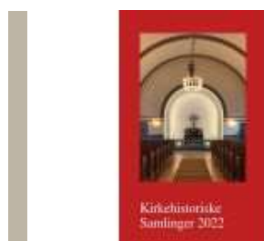
KIRKEHISTORISKE SAMLINGER 2022