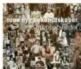
1000 NYE BEKENDTSKABER