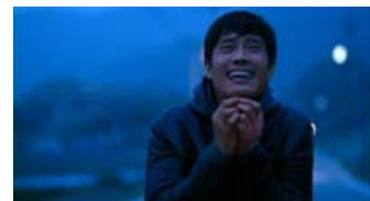
Fig. 6: Protagonisten opløst i tårer.

Især hen imod slutningen rækker filmen ud efter at forløse tragediepotentialet – kraftigt understøttet af den melankolske og længselsfulde underlægningsmusik. Men efter to timer i torturhelvede er det svært at tro på, at Kim græder over tilværelsens meningsløshed og hævnens umulighed – og ikke bare over sin egen bitre skæbne (fig. 6). Filmens moralfilosofiske ramme forbliver et postulat, og derfor ligner tårerne heller ikke meget mere end et tyndt lag fernes over den mæskende dyrkelse af alle tænkelige afarter af overgreb og lemlæstelse. Med en varighed på 141 minutter er der mere end rigelig tid til at svælge i modbydelighederne. Selv benyttede jeg mig flittigt af "kigge væk-finten".