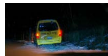
Fig. 1: Morderens gule skolebus. Farven gul anvendes som faresignal.