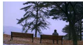
Fig. 3: Klassisk, østasiatisk billedæstetik og motiv: Nåletræer og sneklædte bjergtoppe.

Det er min mistanke, at I Saw the Devil , selvom den påkalder sig eksistensens tragiske dybder, ikke er drevet af meget andet end slet skjult svælgen i ekstrem, æstetiseret vold. I en scene hjemme hos Kyung-chuls lige så psykopatiske kammerat høres Bizets opera Carmen på ghettablasteren, mens man forbereder sig på at torturere og dræbe