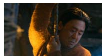
Fig. 5: Morderen med én af sine ildevarslede, gule trøjer.