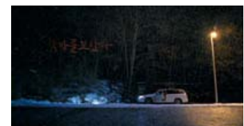
Fig. 2: Den tomme bil som vidnesbyrd om det første mord.