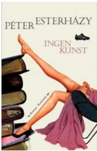
(/boeger/ingen-kunst) INGEN KUNST (/BOEGER/INGEN-KUNST) Af Péter Esterházy