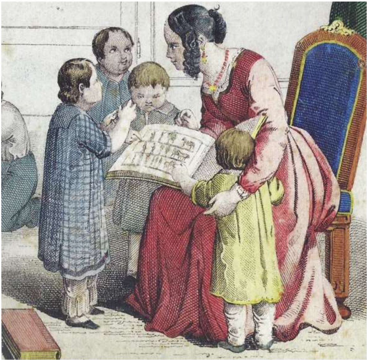
Endnu et eksempel på bogens talrige illustrationer fra tiden omkring 1750-1850: Børn lærer at læse.

Undervejs har de også inddraget de forestillingsverdener og de samfundsforhold, der skabte rammerne for mødet mellem børn og læsestof. Her har de trukket på en bred vifte af ældre og nyere oversigtsværker om uddannelsernes historie, om litteratur, medier, biblioteker og kunst. De har også benyttet sig af historiske værker om bogvæsen, boghandel og teknologiske nyskabelser. Det hele bliver fremlagt i et flydende og letlæseligt sprog, og så er illustrationerne velvalgte og meget sigende. Det er bare så flot.