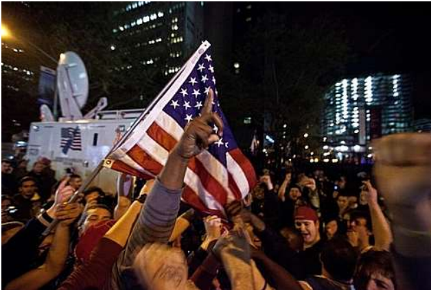
Gadefest i New York efter drabet på Osama Bin Laden den 2. maj 2011.

Og påstanden om ”et utvetydigt nederlag” skyldes ikke kun krudt og kugler og forkert krigsstrategi såsom drab på civile – collateral damage – i jagten på terroristerne, jihadisterne, de militante islamister, og hvad vi ellers på vore breddegrader kalder fjenden.