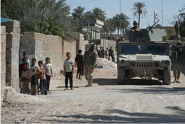
Amerikanske soldater på jagt efter jihadister i Irak.