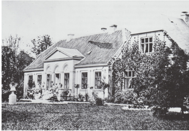
VILLA ST. THOMAS – ET LILLE STYKKE DANSK VESTINDIEN PÅ FREDERIKSBERG