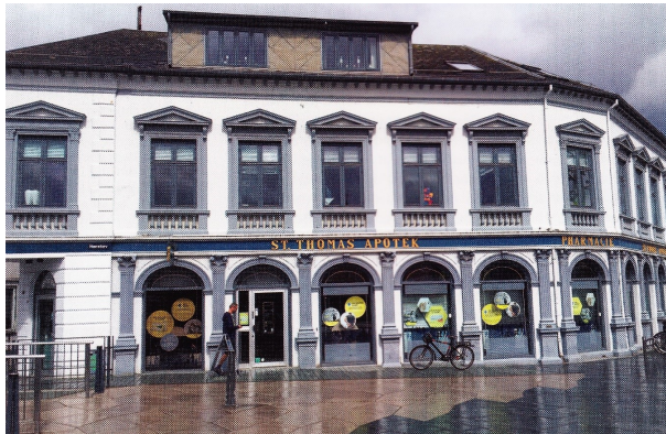
ST. THOMAS APOTEK I VEJLE