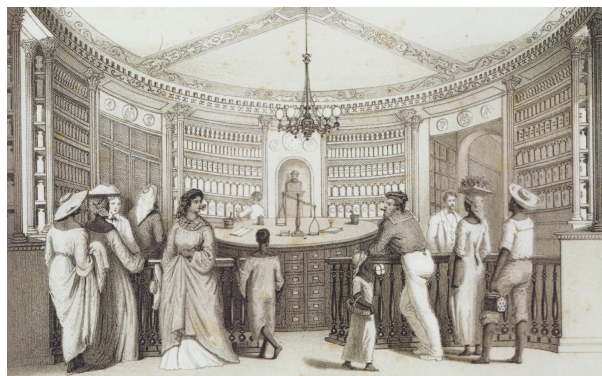
APOTEKET PÅ DRONNINGENSGADE I CHARLOTTE AMALIE.