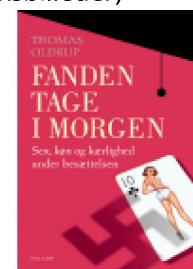
FANDEN TAGE I MORGEN

( http://www.historie-online.dk/boger/hitlers-danmarksbilleder )