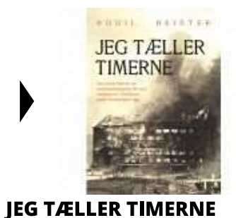
JEG TÆLLER TIMERNE

( http://www.historie-online.dk/boger/anmeldelser-5-5/besaettelsen/jeg-taeller-timerne )