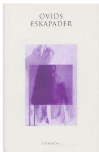
(/boeger/ovids-eskapader) OVIDS ESKAPADER (/BOEGER/OVIDS-ESKAPADER) Af Publius Ovidius Naso