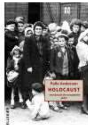
HOLOCAUST - MORDET PÅ DE EUROPÆISKE JØDER

( https://www.historie-online.dk/boger/anmeldelser-5-5/stiftelsen )