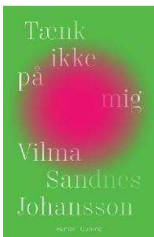
(/boeger/taenk-ikke-paa-mig) TÆNK IKKE PÅ MIG (/BOEGER/TAENK-IKKE-PAA-MIG) Af Vilma Sandnes Johansson