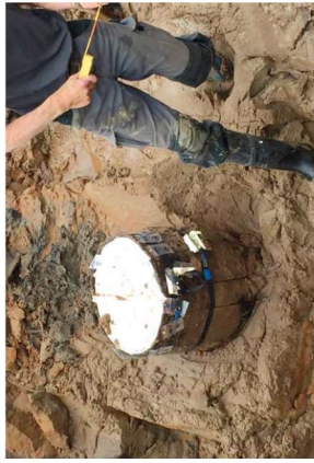
I den ligefte undergrund sydvest for Starup Kirke afviklede en velbevaret brønd op. Brønden er en isoleret tønde, der er fremskilt i Lilleck eller deromkring i tiden 1250-1250.

Afdelingen varetager på vegne af Sløvs- og Kulturstyrelsen tilsynet med fredede fortidsminder og beskyttede stens- og jordluger i de fire sønderjyske kommuner og Kolding Kommune. Således også i 2016, hvor omfanget af tilsynet og dermed det tilknyttede tilskud til opgavens løsning fra styrelsen atter blev mindre. Afdelingen er fortsat på trods af den forringede økonomi, positivt indstillet over for at varetage arbejdet. I 2016 afsluttedes gennemgangen