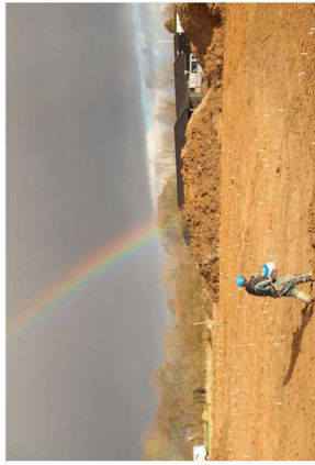
For enden af regnbuen? Et udsnit af den store bebyggelse ved Viggo Carstensenvej uden for Haderslev. Bebyggelsen stammer fra yngre romertid og ældre germansk jernalder, datet mellem 300 og 500 e.Kr.

Afdelingen har i 2016 afgivet 317 beringsvar til lokalplaner, byggesagsudgaver og mange andre typer af sager, der involverer anlægsarbejde under overfladeniveau. Det samlede antal af sager, der har været vurderet i løbet af året er stadig svagt stigende i forhold til årene under krisen. Det er langt over 6000 sager, der passerer museet årligt med henblik på at vurdere, om jordfaste forudsninger kan blive ekkolagt ved anlægsarbejder.