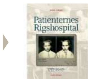
PATIENTERNES RIGSHOSPITAL 1757-2007

( http://www.historie-online.dk/boger/patienternes-rigshospital-1757-