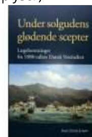
UNDER SOLGUDENS GLØDENDE SCEPTER

http://www.historie-online.dk/boger/anmeldelser-5-5/sport-idaet-krop-sundhed-sygdom/doktor-leunbach-abortlaege-idealist-og-seksualoplyser )