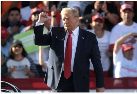
Trump i Arizona.