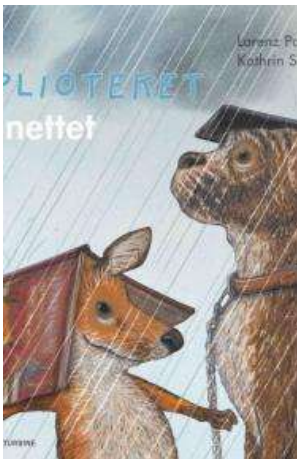
(/boeger/piploteket-paa-nettet) PIPLOTEKET PÅ NETTET (/BOEGER/PIPLOTEKET- PAA-NETTET) Af Lorenz Pauli og Kathrin Schärer (Ill.)