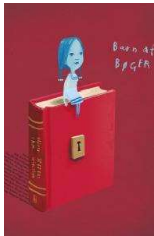
(/boeger/barn-af-boger) BARN AF BØGER (/BOEGER/BARN-AF-BOGER) Af Oliver Jeffers