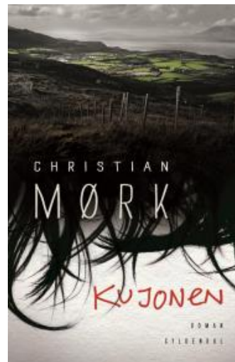
(/boeger/kujonen) KUJONEN (/BOEGER/KUJONEN) Af Christian Mørk