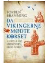
DA VIKINGERNE MØDTE KORSET

( http://www.historie-online.dk/boger/oldtidssagaerne-bind-8 )