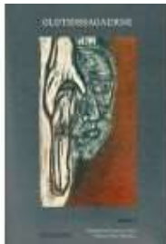
OLDTIDSSAGAERNE, BIND 8

( http://www.historie-online.dk/boger/hvem-tilhoerer-danmark )