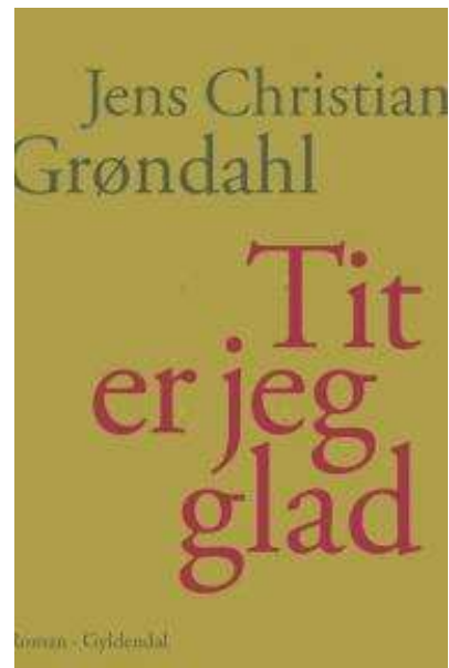
(/boeger/tit-er-jeg-glad) TIT ER JEG GLAD (/BOEGER/TIT-ER-JEG-GLAD) Af Jens Christian Grøndahl