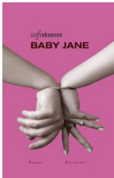
(/boeger/baby-jane) BABY JANE (/BOEGER/BABY-JANE) Af Sofi Oksanen