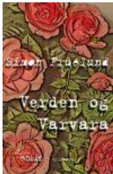
(/boeger/verden-og-varvara) VERDEN OG VARVARA (/BOEGER/VERDEN-OG- VARVARA) Af Simon Fruelund