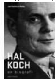
HAL KOCH - EN BIOGRAFI

( http://www.historie-online.dk/boger/anmeldelser-5-5/biografier-erindringer-60-60/hal-koch-en-biografi )