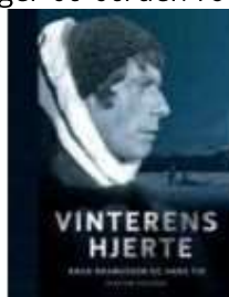
VINTERENS HJERTE - KNUD RASMUSSEN OG HANS TID