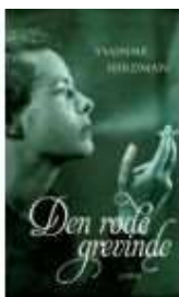
DEN RØDE GREVINDE