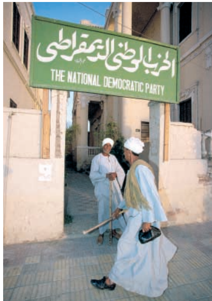
Dialogkultur efterlyses. Her lokalt partikontor i Luxor, Ægypten.

heden af, at Danmark er et lille land uden kolonial fortid i den arabiske verden. Han mener ikke, at Danmarks alliance med USA i Irak i nævneværdig grad har skadet det danske omdømme. Til gengæld er der brug for, at araberne får at vide, at Danmark gør et regulært forsøg på at bidrage til en løsning af Israel-Palæstina-konflikten, som præger alle i den arabiske verden.