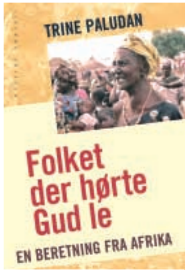
Trine Paludan: Folket der hørte Gud le - En beretning fra Afrika. 253 sider. Forlaget Tiderne Skifter. Kr. 268.