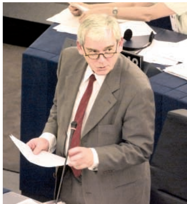
Han satte et dansk fingeraftryk på EU's bistand. Men ikke alt lykkedes for bistandskommissær Poul Nielson.

Kaptajn på en supertanker. Poul Nielson overtog i 1999 EU-direktoratet for bistand, som langtfra fungerede optimalt. Det var en organisation, som havde store vanskeligheder med at klare en af sine mest grundlæggende opgaver: At udbetale allerede bevilligede bistandsmidler. - Problemet opstår bl.a., når tjenestemænd leger politikere, siger den afgående EU-kommissær.