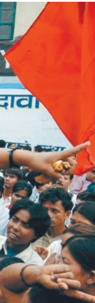
Protestdemonstration mod kong Gyanendras beslutning om at afskedige den lovligt valgte regering. Kathmandu, april.