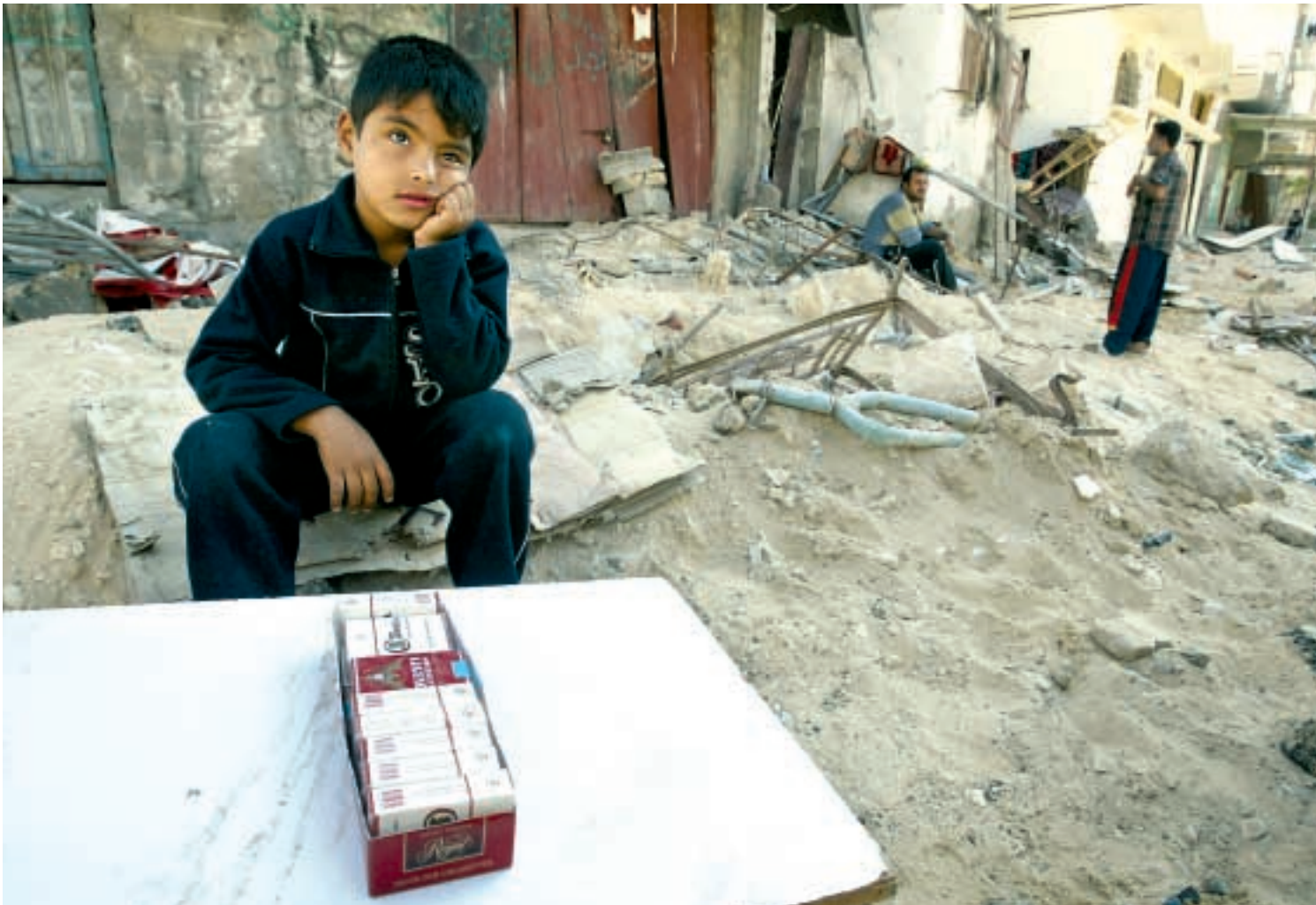
- Et paradoks, at Det Arabiske Initiativ går uden om Israel-Palæstina-konflikten, siger kritiker. Palæstinensisk dreng sælger cigaretter i Rafah flygtningelejren i det sydlige Gaza.