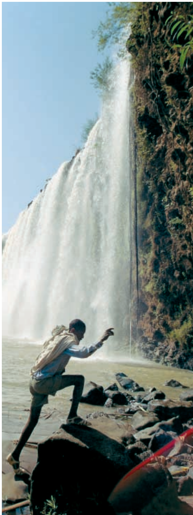
Vandfald ved Bahar Dar i Etiopien, hvor den Blå Nil har sine kilder.

Især Etiopien har ægypternes bevågenhed. 85 procent af Nilens vand udspringer nemlig i Etiopien