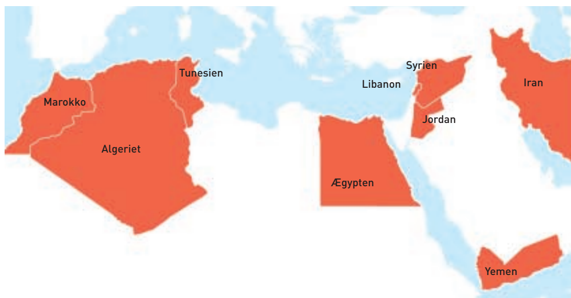
Det Arabiske Initiativ. Her vil Danmark i dialog om demokrati og yde støtte til reformer.