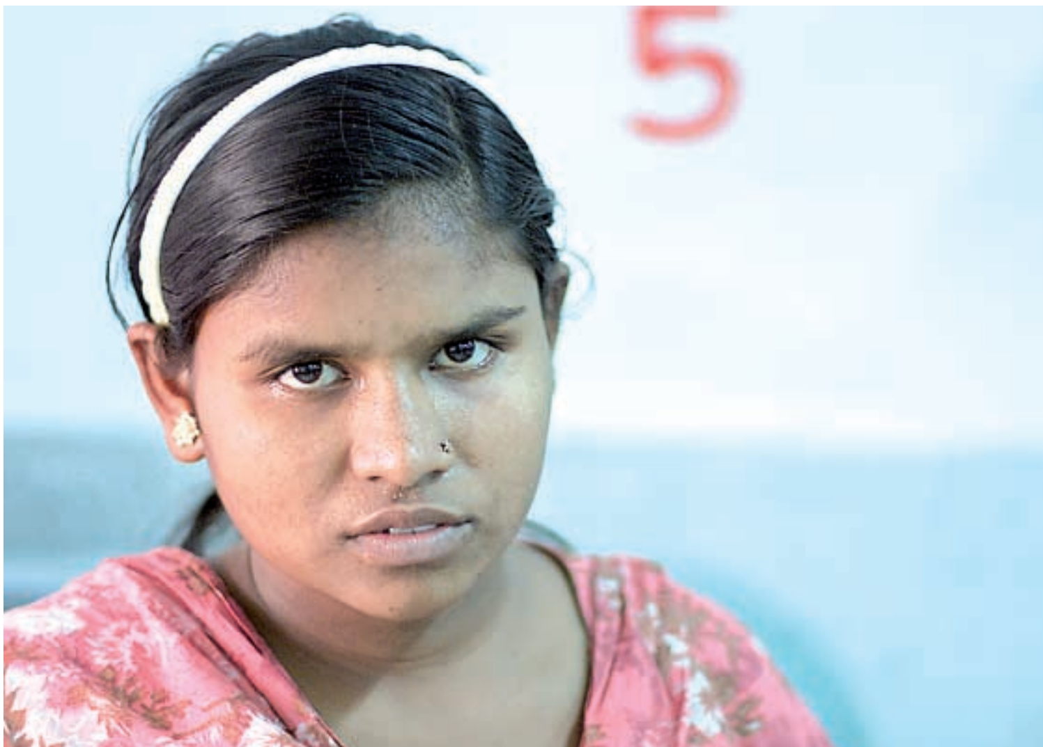
Ruma var tjenestepige i et privat hjem, hvor hun blev voldtaget af sin arbejdsgivers nevø. Men Bangladesh har i dag ikke udstyr til at lave en dna-profil af barnet, så hun kan ikke bevise, at nevøen er faderen.

- Et dna-laboratorium er ofte drevet og ledet af politiet, men da politiet i Bangladesh er kendt som særdeles korrupt og for at lave fal-