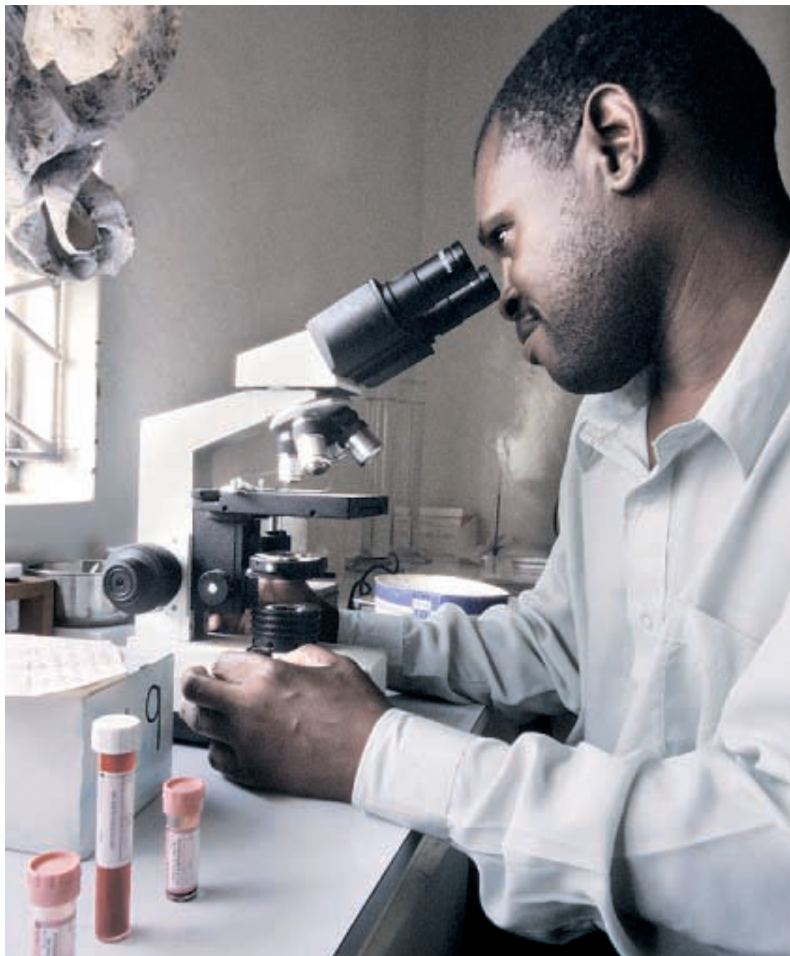
Ingen lette løsninger i sigte. Her et sundhedscenter i Ndola City, Zambia.