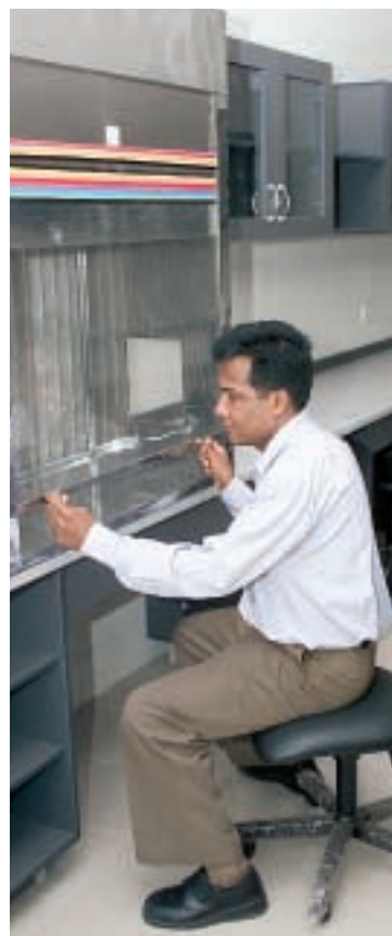
Dna-laboratoriet på Dhakas største hospital, bliver det første i landet. Her undersøger en af hospitalets retsmedicinere faciliteterne, som forventes at være klar til brug inden for tre måneders tid.