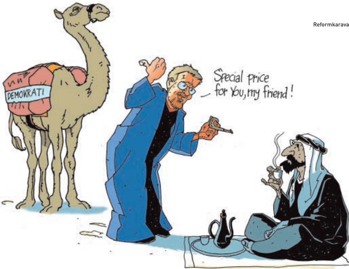
Reformkaravanen kommer. Illustration: Knud Andersen/ Skønvirke.