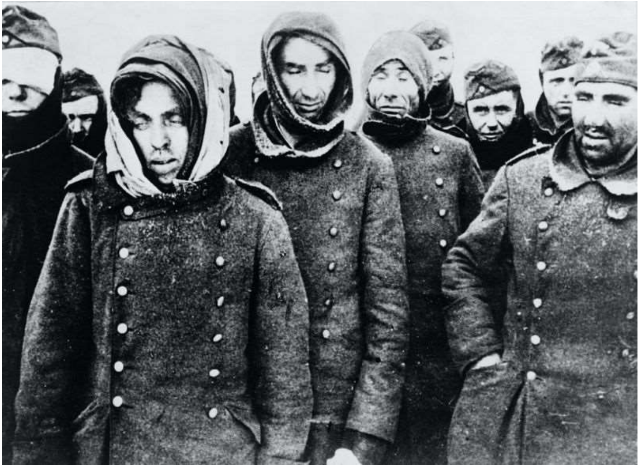
Tyske krigsfanger efter nederlaget ved Stalingrad 130 år senere

Det er ganske godt dokumenteret, at den tyske diktator Adolf Hitler var belæst. Hans utrolige hukommelse spillede en stor rolle. Men læresætningen fra Napoleons felttog mod Moskva i 1812 må han have tillagt ringe betydning. I modsætning til Fieldmarskal Montgomery der iskoldt noterer: "På den første side i bogen om krigsførelse står den første og vigtigste læresætning: Marchér aldrig mod Moskva" – underforstået at russernes kampstyrker og ikke mindst vilje i samspil med det frygtede russiske efterår og den isnende vinter kunne man ikke besejre.