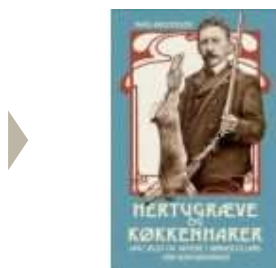
HERTUGRÆVE OG KØKKENHARER