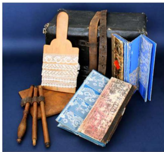
En kniplingskræmmerens lusererskrin. Kræmmeren havde skrinet på ryggen, når han gik til marked. Foran skrinet ses dets indhold: Prøvebøger med kniplingsprøver, en delbar-alenstok og et væklebræt med kniplinger omkring.

gik. Anledningen var 250-året for salmedigteren H.A. Brorsons død, og emner i tilknytning til Brorson og pietismen prægede foredrag, musikaftener og mange andre arrangementer i årets løb. I forbindelse med udstillingen har der været afholdt mange rundvisninger, bl.a. for konfirmander.