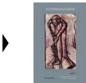
OLDTIDSSAGAERNE. BIND 1 OG BIND 2

( http://www.historie-online.dk/boger/anmeldelser-5-5/forhistorisk-tid-12-12/oldtidssagaerne-bind-1-og-bind-2 ) ( http://www.historie-online.dk/boger/rigets-runer )