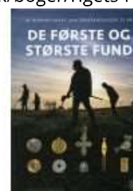
DE FØRSTE OG DE STØRSTE FUND