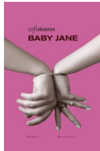
(/boeger/baby-jane) BABY JANE (/BOEGER/BABY-JANE) Af Sofi Oksanen