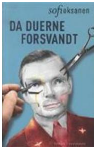
(/boeger/da-duerne-forsvandt) DA DUERNE FORSVANDT (/BOEGER/DA- DUERNE-FORSVANDT) Af Sofi Oksanen