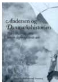
ANDERSEN OG DANMARKSHISTORIEN

( http://www.historie-online.dk/boger/guldalderens-billedverden )