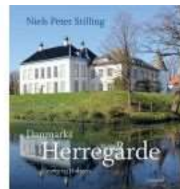
DANMARKS HERREGÅRDE - SLESVIG OG HOLSTEN

( http://www.historie-online.dk/boger/danmarks-herregaarde-slesvig-og-holsten )