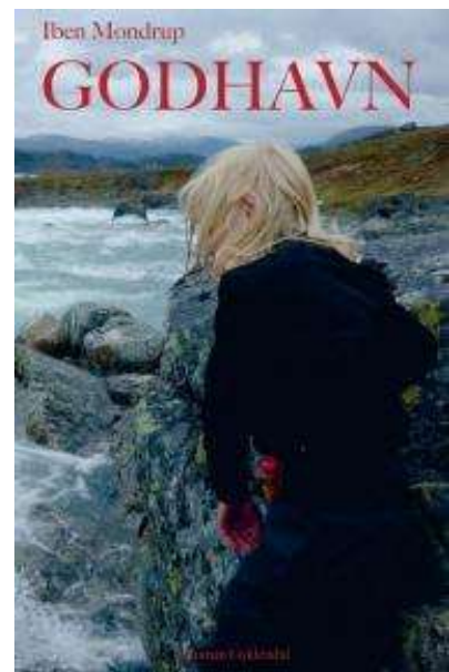
(/boeger/godhavn) GODHAVN (/BOEGER/GODHAVN) Af Iben Mondrup