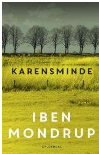
(/boeger/karensminde) KARENSMINDE (/BOEGER/KARENSMINDE) Af Iben Mondrup