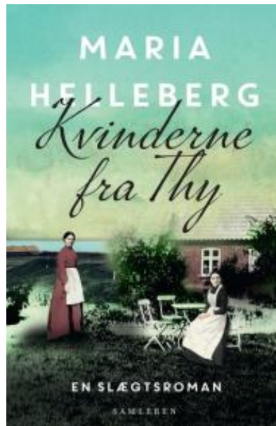
(/boeger/kvinderne-fra-thy) KVINDERNE FRA THY (/BOEGER/KVINDERNE-FRA-THY) Af Maria Helleberg