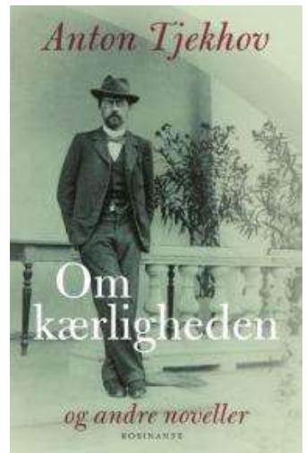
(/boeger/om-kaerligheden-og-andre-noveller-0) OM KÆRLIGHEDEN - OG ANDRE NOVELLER (/BOEGER/OM-KAERLIGHEDEN-OG-ANDRE-NOVELLER-0) Af Anton Tjekhov