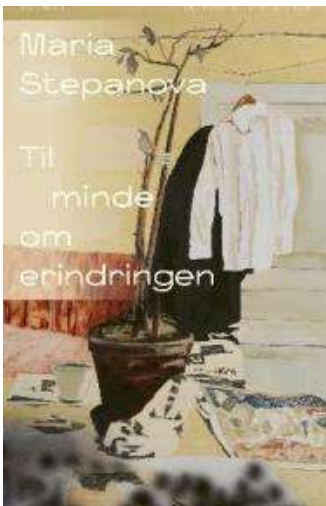
(/boeger/til-minde-om-erindringen-en-romance) TIL MINDE OM ERINDRINGEN (/BOEGER/TIL-MINDE-OM-ERINDRINGEN-EN-ROMANCE) Af Maria Stepanova