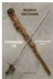
TYRANNENS TID: OM SVERIGE UNDER KARL XII

( http://www.historie-online.dk/boger/tyrannens-tid-om-sverige-under-karl-xii )