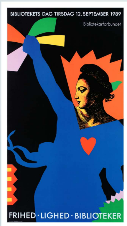
Plakaten Frihed, Lighed, Biblioteker er udgivet af Danmarks Bibliotekarforbund i anledning af Bibliotekets Dag den 12. september 1989. Gengivet med venlig tilladelse fra Forbundet Kultur & Information. Kunster: Burmester Bejsebækken. Dansk Bibliotekshistorie, indledningen til bind 2, fra Aarhus Universitetsforlag

Å gå inn i dette omfattende verket som helhet er det ikke rammer for her. Verket framstår, så langt denne melder kan