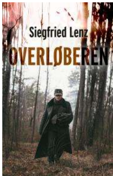
(/boeger/overloberen) OVERLØBEREN (/BOEGER/OVERLOBEREN) Af Siegfried Lenz