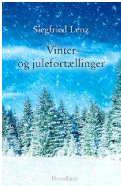
(/boeger/vinter-og-julefortaellinger) VINTER- OG JULEFORTÆLLINGER (/BOEGER/VINTER-OG- JULEFORTAELLINGER) Af Siegfried Lenz