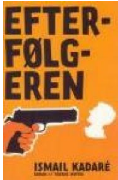
(/boeger/efterfolgeren) EFTERFØLGEREN (/BOEGER/EFTERFØLGEREN) Af Ismail Kadaré