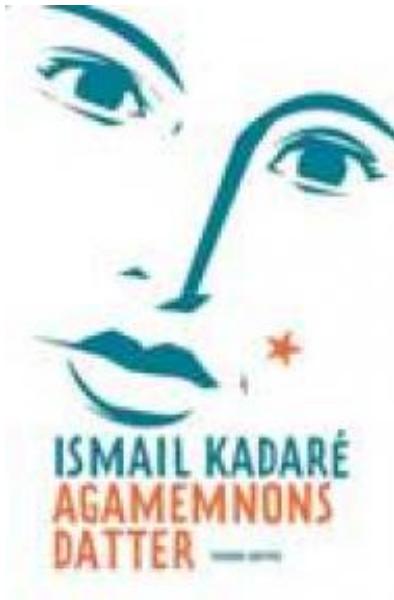
(/boeger/agamemnonns-datter) AGAMEMNONS DATTER (/BOEGER/AGAMEMNONS-DATTER) Af Ismail Kadaré