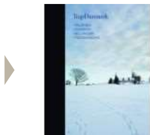
TRAP DANMARK BIND 26

( http://www.historie-online.dk/boger/trap-danmark-bind-26 )