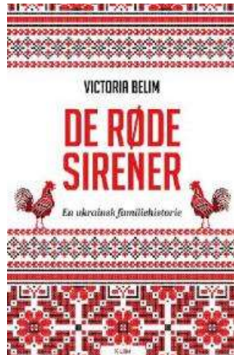
(/boeger/de-roede-sirener-en-ukrainsk-familiehistorie) DE RØDE SIRENER - EN UKRAINSK FAMILIEHISTORIE (/BOEGER/DE-ROEDE-SIRENER-EN-UKRAINSK-FAMILIEHISTORIE) Ar Victoria Belim