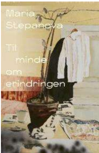
(/boeger/til-minde-om-erindringer-en-romance) TIL MINDE OM ERINDRINGER (/BOEGER/TIL-MINDE-OM-ERINDRINGER-EN-ROMANCE) Ar Maria Stepanova